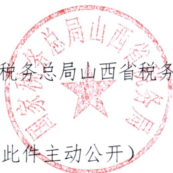
国家税务总局山西省税务局