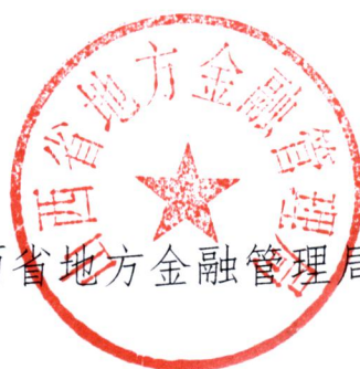
山西省地方金融管理局