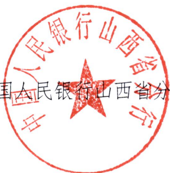
中国人民银行山西省分行