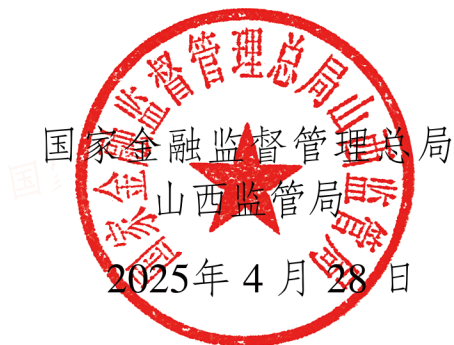
国家金融监督管理总局 山西监管局