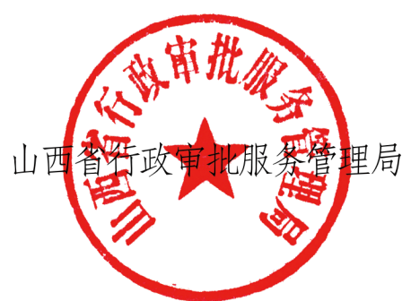
山西省行政审批服务管理局