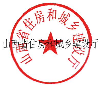
山西省住房和城乡建设厅