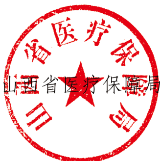
山西省医疗保障局